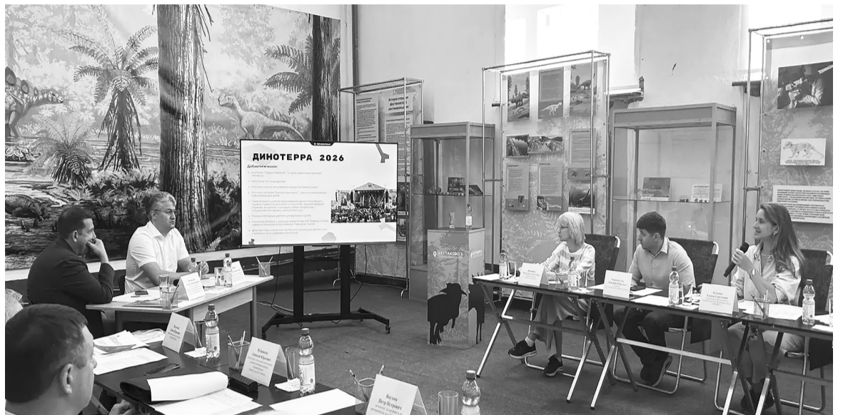
Идёт заседание выездного штаба