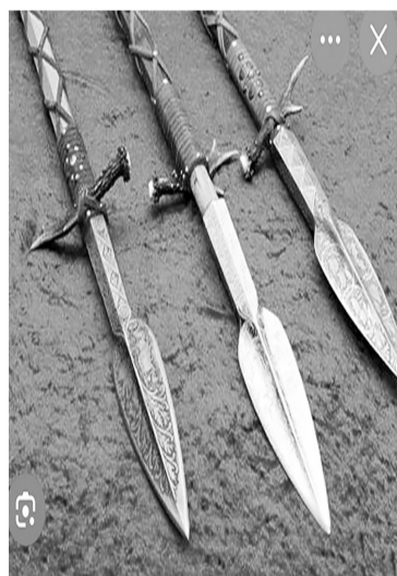
Раньше к рогатине привязывали кусочек рога с помощью сыромятной кожи.

Это копьё необыкновенно тем, что для охоты на медведя оно делается тяжелое, потому что этим копьём не надо в бою орудовать, а предназначено оно для одного удара, чтобы сразу сокрушить медведя. Орудие называется «рогатина», потому что охота на медведя строится так: когда медведь на охотника начинает налетать - даже если на нем со всех сторон виснут собаки - он не обращает на них внимания и летит прямо на охотника. У медведя есть такая привычка: перед тем как напасть на охотника, он