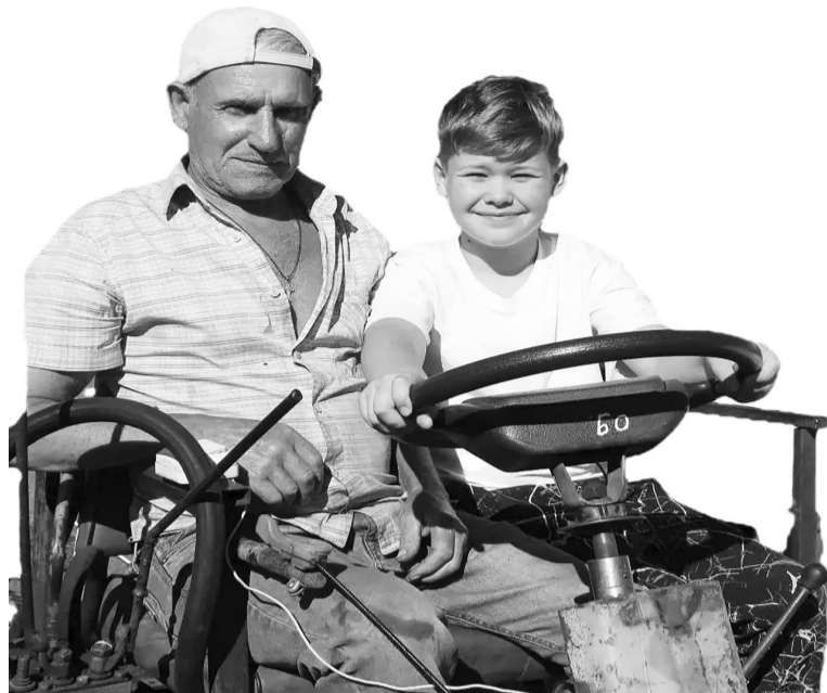
Любят внуки летом погостить у бабушки с дедушкой, прокатиться на тракторе, какого нигде больше нет. Его дед придумал!

Этот мальчишеский опыт пригодился мне, когда учился