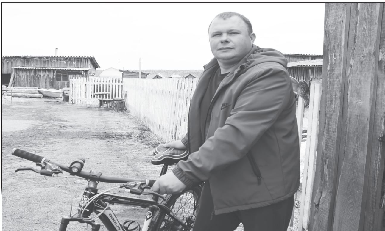
Вообще велосипед - моя страсть. И успокаивает езда на нем, и для здоровья полезно. Рекомендую всем.

- Нет, нам это категорически запрещено, минимум по двое. Сверху может упасть горящая балка или чем другим придавить. Напарник должен подстраховать.