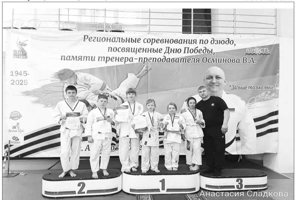
Праздник силы, ловкости и спортивного духа