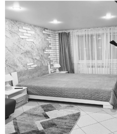
В каждом номере телевизор, Wi-Fi работает отлично.

шин и недостатка в комнатах отдыха на территории начали строить двухэтажную гостиницу. В ней будет еще семнадцать номеров высокого уровня обслуживания. Сейчас идут строительные работы.