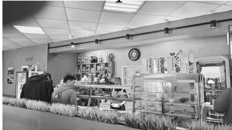
Очень красиво, уютно, великолепное обслуживание...