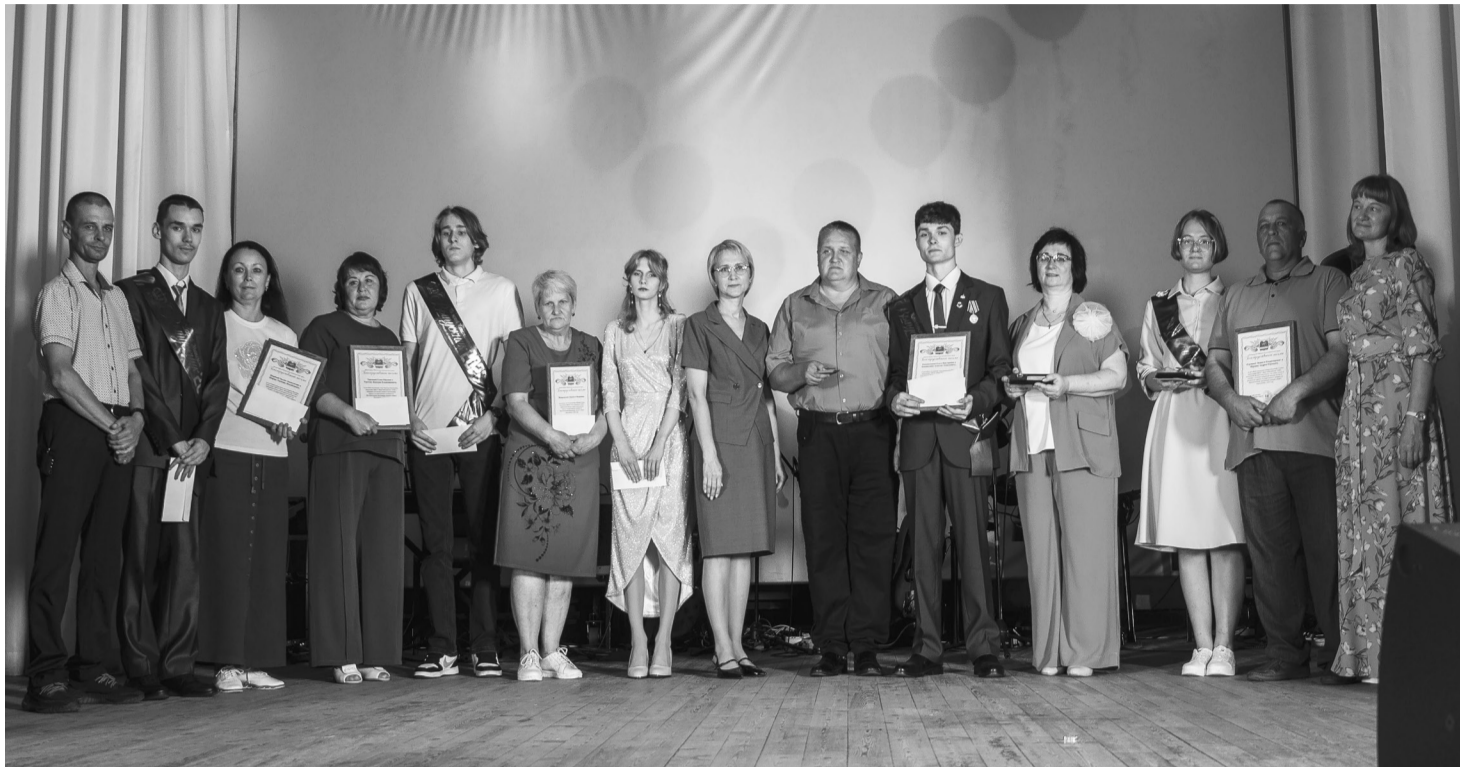
На сцене - выпускники, набравшие на ЕГЭ 80 баллов и выше, с родителями.

Центром праздника стал Верх-Чебулинский культурно досуговый центр: именно там прошло торжественное мероприятие для части выпускников. Остальные ребята получили документы на базе своих школ. Мероприятие началось с торжественных слов ведущих и величественного звучания гимна России - момента, когда особенно остро чувствуешь причастность к своей стране и ответственность перед ней.