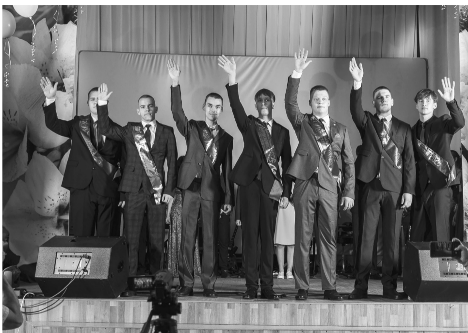
Пусть впереди будет много побед и интересных открытий